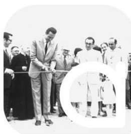
1967 Fondazione Apsov Società Cooperativa

Apsov è nata come cooperativa agricola nel 1967 a Voghera