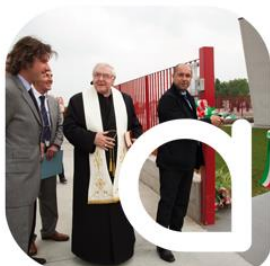
2011 Inaugurazione nuovo sito produttivo Apsosementi

Oggi una delle più importanti società italiane nel settore delle sementi di cereali a paglia e foraggere